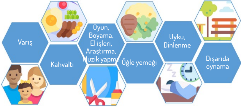
Resim 1: Almanya'daki bakım imkânlarının sadeleştirilmiş görünümü