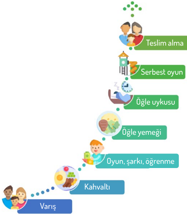
Resim 1: Almanya'daki bakım imkânlarının sadeleştirilmiş görünümü